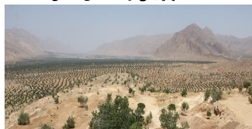
تصویری از باغات انجیر دیم استهبان