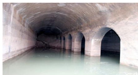
تصویری یکی از قنات‌های کاشان