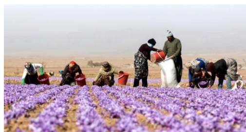
تصویری از برداشت زعفران در گناباد

که صورت گرفت، تا کنون چهار نظام شامل ۱- نظام کشاورزی مبتنی بر قنات در کاشان (سال ۲۰۱۴)، ۲- نظام تولید انگور و فرآورده‌ها در دره جوزان ملایر (سال ۲۰۱۸)، ۳- نظام سنتی زعفران مبتنی بر قنات گناباد (سال ۲۰۱۸) و ۴- نظام باغات انجیردیم در استهبان (سال ۲۰۲۳) ثبت شدند. دو پروپوزال نظام سنتی باغات باستانی قزوین، نظام و نظام سنتی کشت گردوی تویسرکان در مراحل ثبت می‌باشند.