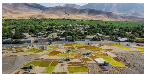
تصویری از دره جوزان ملایر در زمان برداشت انگور