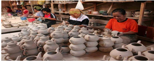
شکل ۱- سفال کاسونگان در اندونزی

بازارهای جهانی مانند اروپا، ژاپن، استرالیا و کانادا شده است. این صنعت با شیوع همه‌گیری کرونا از ابتدای سال ۲۰۲۰ بازاریابی آنلاین محصولات را آغاز کرده است. وجود چنین صنایعی نه تنها برای حفظ معیشت روزمره اهمیت دارد، بلکه تلاشی برای حفظ میراث گرانبها و ارزشمند گذشتگان محسوب می‌شود. توجه و دغدغه جوامع محلی و همچنین حمایت و پشتیبانی قانونی دولت یکی از راهکارهای حفظ این صنعت است.